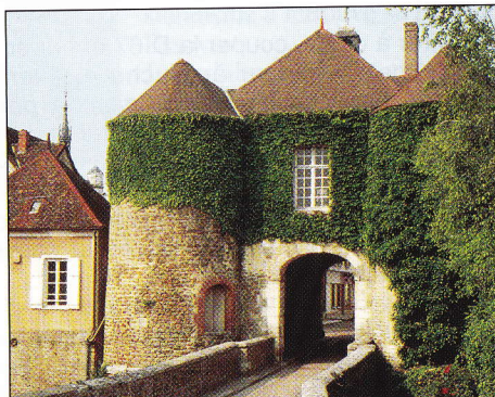
Porte Saint-Nicolas à Ervy-le-Châtel.

sit en 1836 une curieuse halle... circulaire, en torchis, pans de bois et briques, coiffée d'un triple toit.