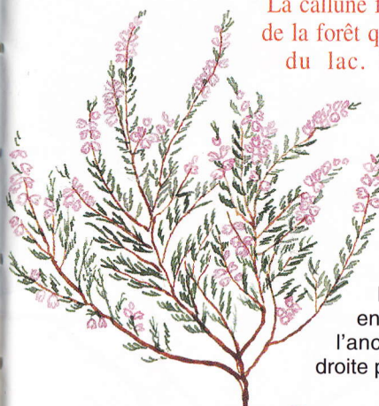
Callune (fausse bruyère). Dessin N. L.

La callune fleurit dans les sous-bois de la forêt qui s'étend jusqu'au bord du lac. Là plus qu'ailleurs, oiseaux migrateurs et pêcheurs font bon ménage.