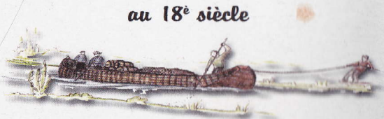
au 18 e siècle